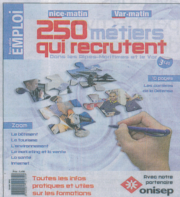
Le hors-série est en vente dans les kiosques à partir d'aujourd'hui au prix de 3,40 euros. (Infographie S. Collie)

Un zoom de dix pages est consacré à la Défense. Que cela soit la Marine, l'armée de l'air ou de terre, les possibilités sont vastes et les