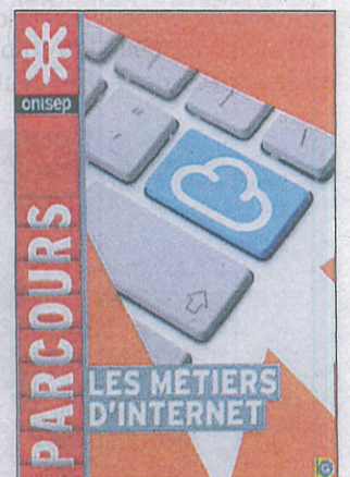
Le guide des métiers d'Internet est publié dans la collection Parcours, chez notre partenaire, l'Onisep.

Nous consacrons plusieurs pages aux métiers d'Internet. Les métiers de ce secteur spécifique ne sont pas strictement liés au secteur dit de l'informatique. Internet a en effet besoin de graphistes, de commerciaux, de chefs de projets, d'experts en sécurité, de développeurs, de consultant web, de traffic manager , de veilleurs stratégique et autres community manager . De nombreuses entreprises recrutent. Attention : le niveau exigé est souvent de l'ordre de bac+3, parfois même plus. Notre guide donne les clés nécessaires pour débiter une carrière dans ce secteur. Pour plus d'informations retrouvez le guide de notre partenaire l'Onisep. Il est très complet, très concret, et les descriptions de ces nouvelles pro-