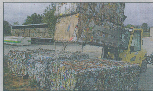
Le tri du papier est un des enjeux majeurs de demain.

C'est le grand enjeu de demain. Les métiers de l'environnement sont naturellement appelés à se développer. Ce qui est intéressant dans ce secteur ? La gamme des profils demandés. De l'ouvrier non qualifié au chercheur, du niveau 3 e au master de chimie doublé d'un master de droit. Mais attention, désormais des écoles et des voies de formations parfaitement adaptées existent. À tous les niveaux et pour toutes les spécialisations. Les métiers se professionnalisent et s'industrialisent. Qui dit meilleure formation dit meilleure rémunération. L'image des métiers liés à l'environnement est donc en train de changer considérablement et sans doute... durablement!