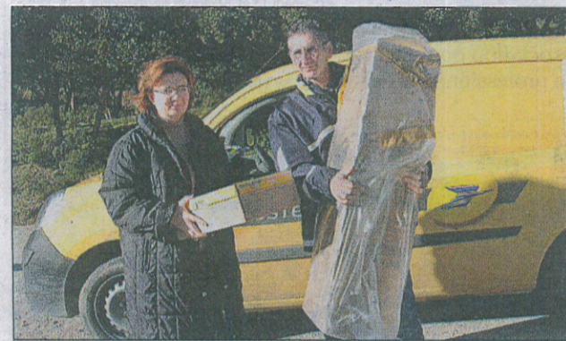
La distribution des colis explose avec le développement du commerce en ligne.

Dans notre magazine, nous consacrons plusieurs pages à La Poste. Et pour cause, ce géant (plus de 6600 agents dans le Var et les Alpes-Maritimes) est l'un des premiers employeurs du territoire. La force de l'enseigne ? Sa capacité d'adaptation. Ainsi, le métier de facteur a considérablement évolué. Celui de conseiller bancaire