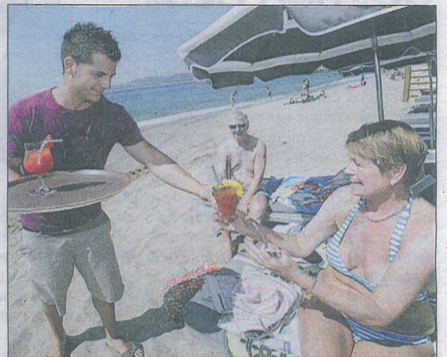
Le tourisme demeure une valeur sûre pour relancer sa carrière.

Autre poids de l'économie du Var et des Alpes-Maritimes : le secteur du tourisme. Même si ce secteur connaît des aléas, il demeure une source de débouchés, notamment pour un premier poste. Attention, ces métiers se professionnalisent, et désormais, les